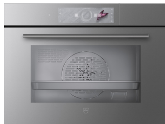
Specchio platino con maniglia