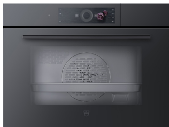
Specchio nero con maniglia